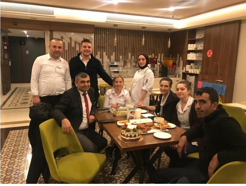
“Sezon Sonu Kutlamaları”