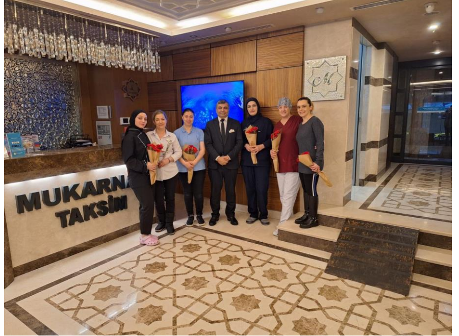
“Anneler Günü Kutlamaları”

Her yıl sonunda, yılın yorgunluğunu atmak ve motivasyonumuzu arttırmak için personellerin istek ve arzuları doğrultusunda tüm personel için aktivite günleri düzenlenmektedir.